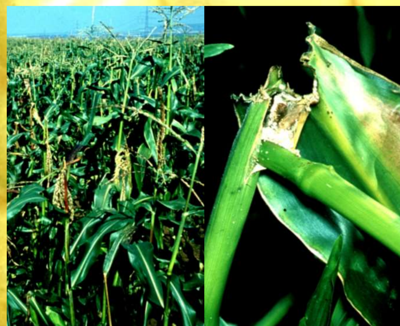
Geknickte Maisfahne nach starkem Befall (links). Die Raupen minieren in den Stängeln, die danach umknicken; Bohrmehl ist sichtbar (rechts)