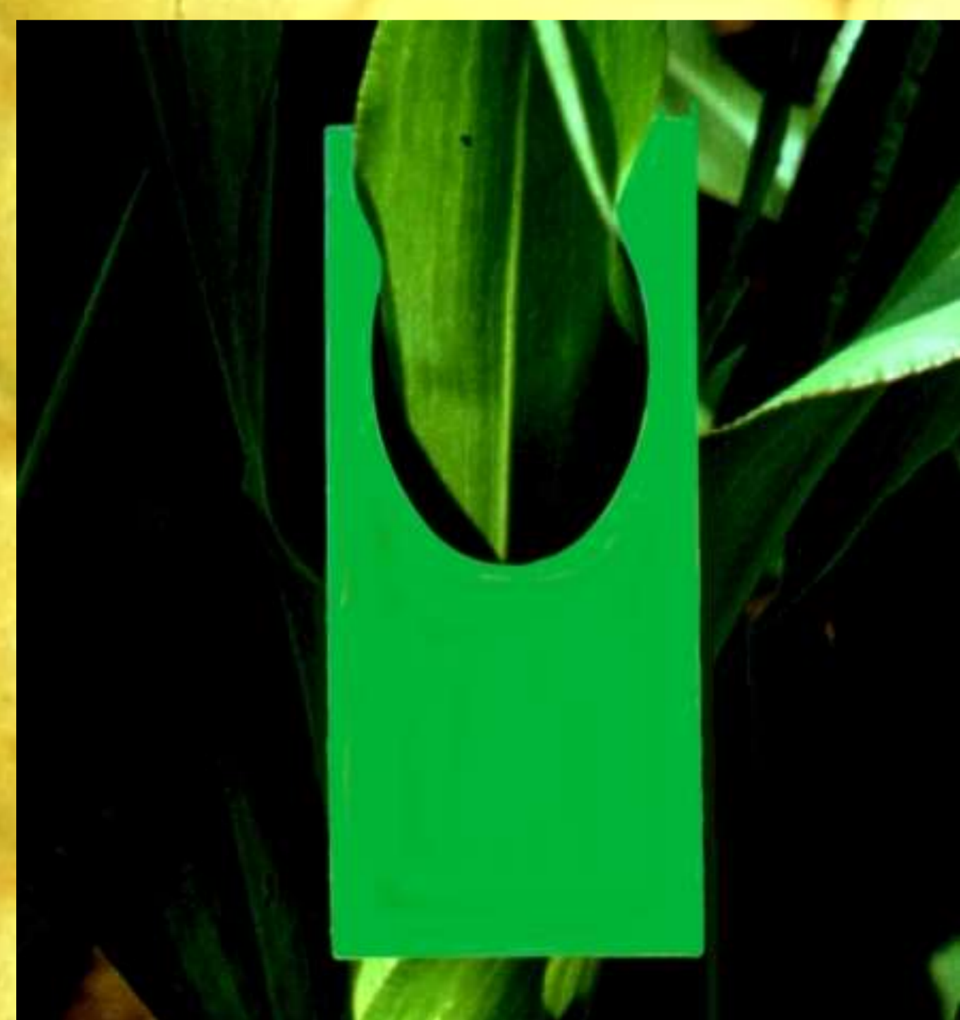
Freilassungskärtchen für Trichogramma