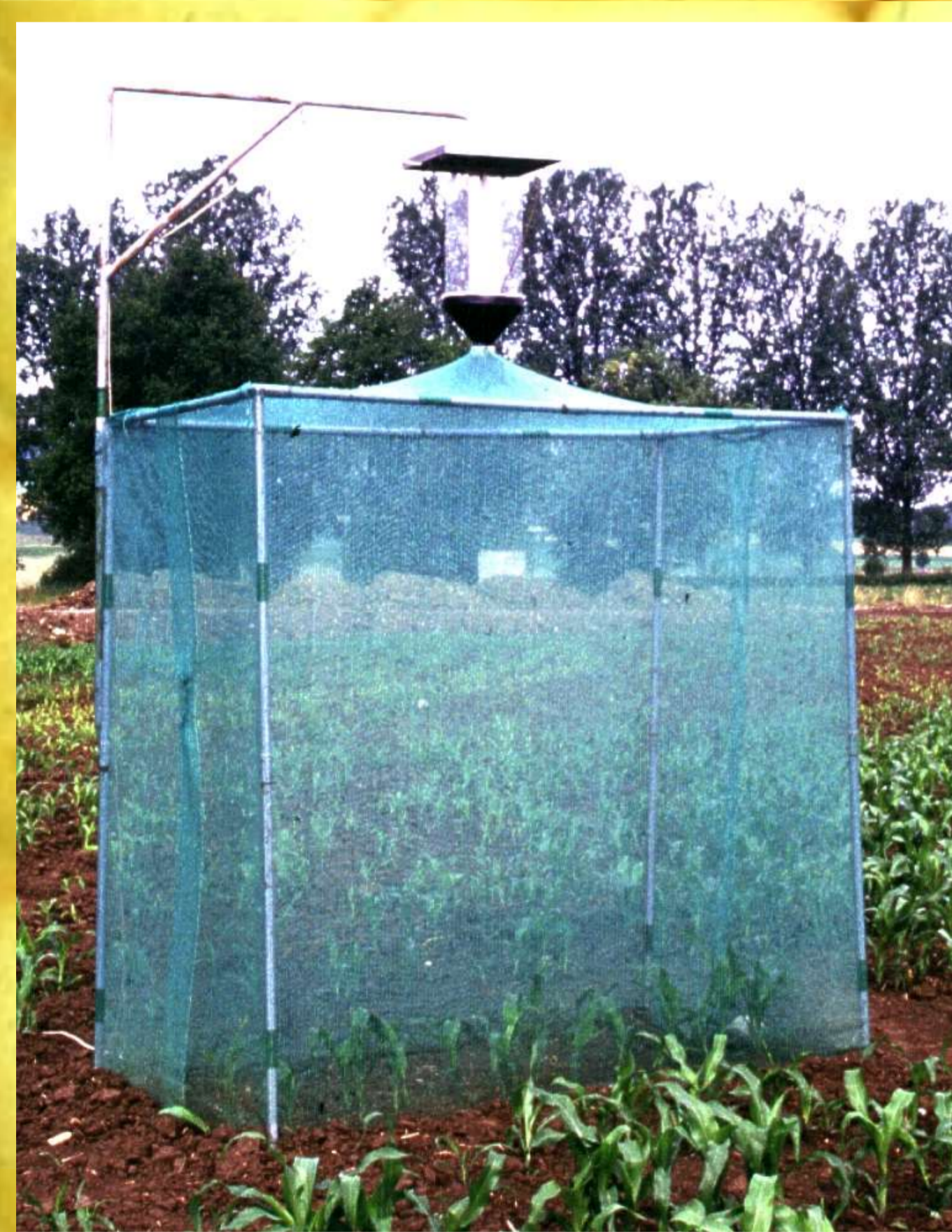
Lichtkäfigfalle zur Befallüberwachung