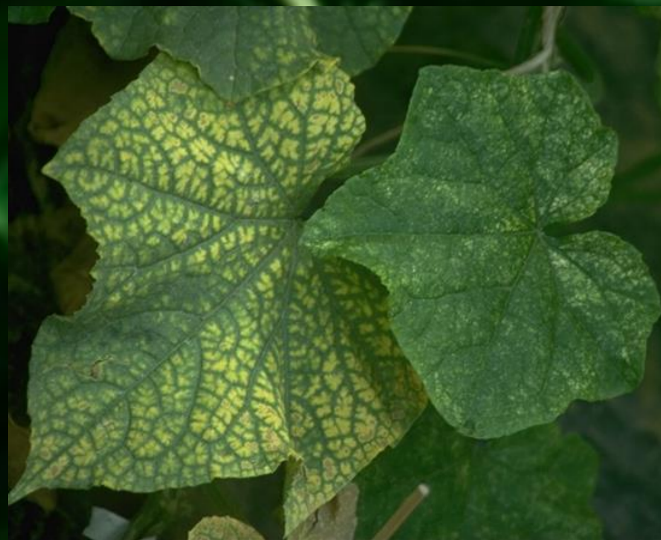
Gelbfärbung einzelner Blattzellen von Gurkenblättern durch Aussaugen der Spinnmilben