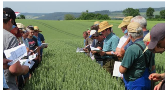
Blick ins Feld.

Im Getreide stehen aktuell wichtige Behandlungsentscheidungen an. Das wechselhafte Wetter begünstigt Pilzinfektionen. Auch einige Prognosemodelle, die eine wertvolle Unterstützung bei der Entscheidungsfindung sind, schlagen Alarm. Allerdings müssen bei der Entscheidung je nach Bewirtschaftungseinheit neben Wetter und Infektionswahrscheinlichkeit noch weitere Punkte einbezogen werden: