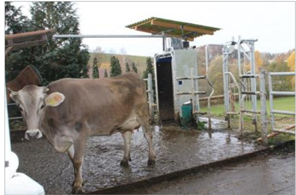
Bild 2: Über ein dezentrales Selektionstor (links) im Auslauf kann der Zugang zur Weide tierindividuell gesteuert werden. Über ein Einwegtor können die Tiere jederzeit zum Stall zurückkehren (rechts).

Aus den vielfältigen Faktoren der Tabelle 1 wird ersichtlich, dass die konkrete Ausgestaltung eines Systems mit automatischem Melken und Weidegang im Einzelbetrieb zunächst sehr stark von verfügbaren Weideflächen mit direkter Anbindung an den Stall abhängt. Sie entscheiden über die grundsätzliche Realisierbarkeit, über das Weidesystem, die tägliche Zugangsdauer und die Besatzstärke. Über die Maßnahmen der Fütterung von Kraft- und Grundfutter im Stall können Impulse zum Besuch von Stall und AMS gesetzt werden.