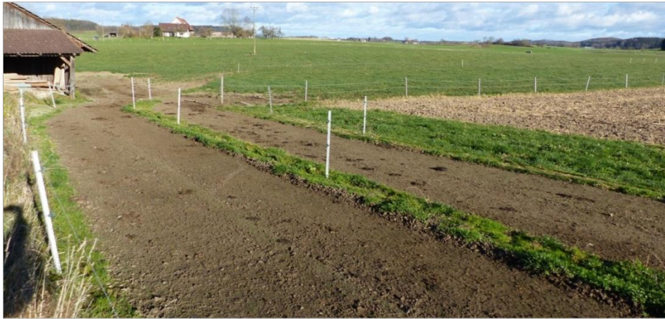
Bild 4: Besonderes Augenmerk ist auf die Gestaltung der Triebwege zu legen. Sie dürfen nicht steinig oder morastig sein.

Schattenplätzen (Stallung, Unterstand, Bäume, usw.) und Witterungsschutz (z.B. Bäume und Hecken) ist genauso zu achten, wie auf die Wasserversorgung.