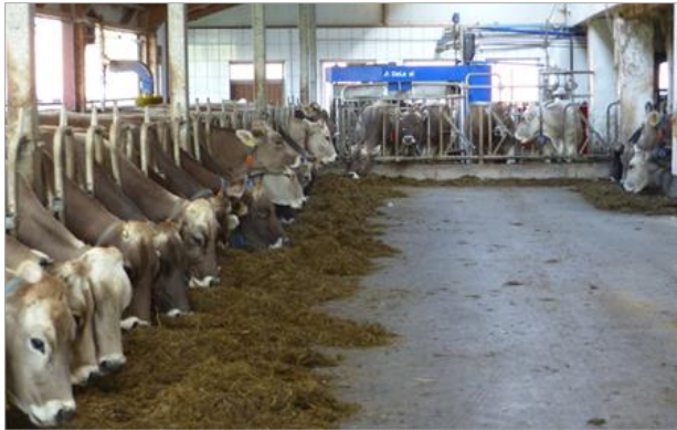
Bild 1: In der Regel steht das Melksystem im Stall. Für eine gute Auslastung sind schmackhaftes Krafffutter in der Melkstation und die tägliche Zufütterung von attraktivem Grundfutter am Trog nötig. Bei fehlender Anbindung zum Stallausgang kann ein dezentrales Tor den Weidezugang steuern (Bild 2).

melken zu lassen. Dafür müssen Anreize geschaffen werden, wie zum Beispiel schmackhaftes Krafffutter im AMS, Zufütterung von attraktivem Grundfutter, gutes Stallklima und ausreichendes Platzangebot im Stall. Die „Schmiermittel“ für den notwendigen Pendelverkehr zwischen Weide und Stall sind mobile, d.h. fußgesunde Kühe. Eine direkte Stall-Weide-Anbindung und möglichst kurze, aber vor allem auch tiergerechte Verbindungswege (weicher Boden, möglichst ohne Steine, kein Morast). Neben dem freien Kuhverkehr zwischen Weide und Stall kann der Zugang zur Weide über dezentrale automatisierte Selektionstore (Bild 2) oder zentral über die Melkstation (Bild 3) auch einzeltierbezogen erfolgen. Um den Nachtreibeaufwand zu minimieren und die Auslastung des AMS zu verbessern kann der Weidegang z.B. Kühen mit bevorstehendem Melkanrecht verweigert werden. Zugangsbeschränkungen zur Weide sind ebenso nötig, wenn nur wenig Weidefläche zur Verfügung steht oder die Flächen nass sind und dadurch die Gefahr von Grasnabenschädigung bei zu intensiver Nutzung besteht.