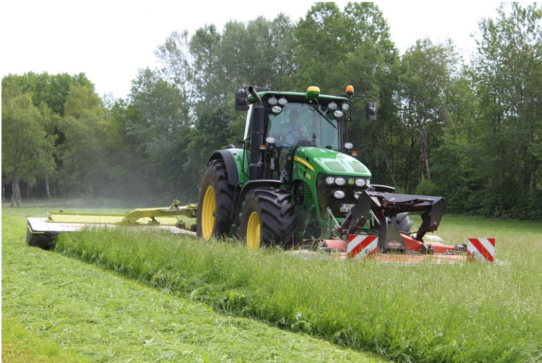
Abbildung 1: Schmetterlings-Mähkombination im Einsatz (ein Front- und zwei Heckmähwerke).

Mähverluste spielen bei Wildtieren eine große Rolle. Für das Jungwild wie Feldhasen, Rehkitze und Bodenbrüter gab es in der Evolution eine gute Überlebensstrategie: Bei Annäherung einer Gefahr reglos am Boden liegend zu verharren und sich auf die Tarnfärbung zu verlassen anstatt zu fliehen. Bei der heutigen Grünlandbewirtschaftung mit walzen, häufigen Schnitten, schnellen Maschinen und großen Arbeitsbreiten ein fataler Fehler.