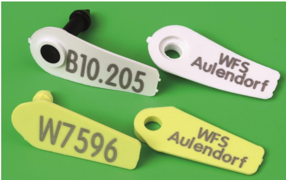
Abbildung 3: Oben: neue Marke (Supertag Size 1), unten: alte Marke (Jumbo Rototag)

Bei der Rehwildmarkierung gibt es dieses Jahr Veränderungen. Da die bisher verwendete Marke nicht mehr hergestellt wird, verwenden wir nun einen neuen Markentyp. Wenn Sie noch mit der alten Jumbo-Ohrmarke markieren wollen (siehe Abbildung 3), können wir Ihnen für die nächsten Jahre noch Restbestände anbieten. Bitte geben Sie bei der Bestellung der Marken an, welchen Markentyp sie wünschen.